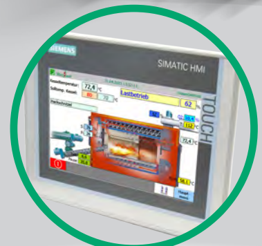
Regulación con pantalla táctil de Siemens