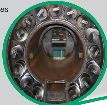
Intercambiador de gran eficiencia con limpieza automática